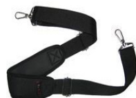
SANGLE À ÉPAULE 2 POINTS